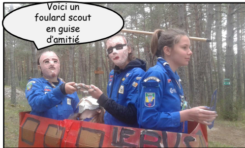
Voici un foulard scout en guise d'amitié