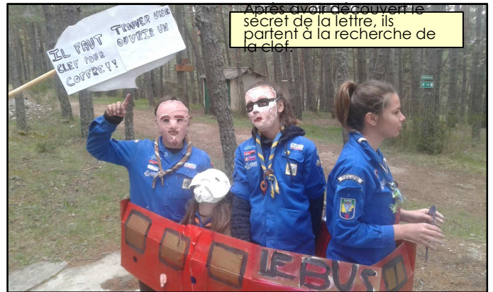
Après avoir découvert le secret de la lettre, ils partent à la recherche de la clé.