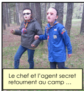
Le chef et l'agent secret retournent au camp ...