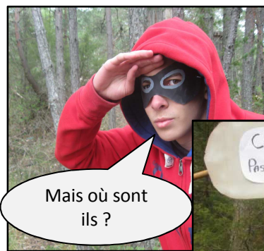
Mais où sont ils ?