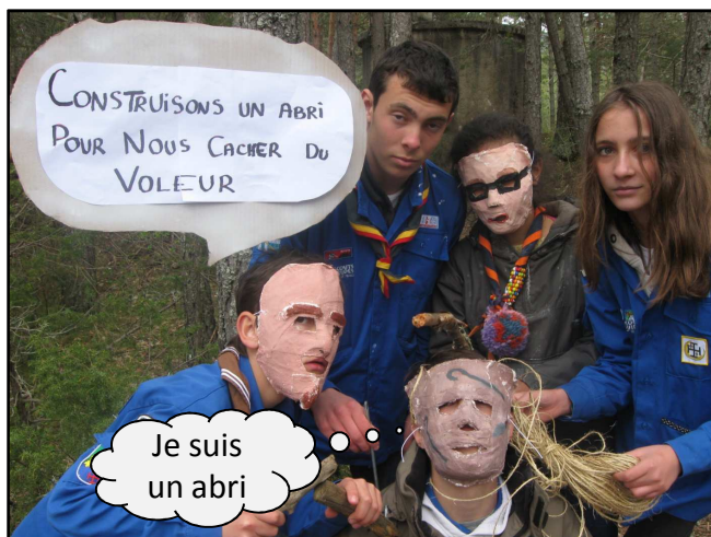
CONSTRUISONS UN ABRI POUR NOUS CACHER DU VOLEUR