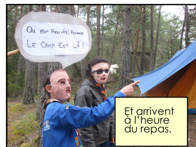
ON EST ARRIVÉS REGARDE LE CAMP EST LÀ !