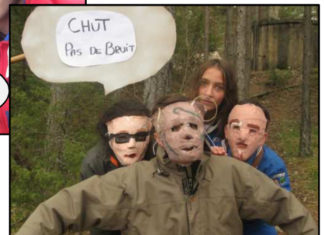
CHUT PAS DE BRUIT